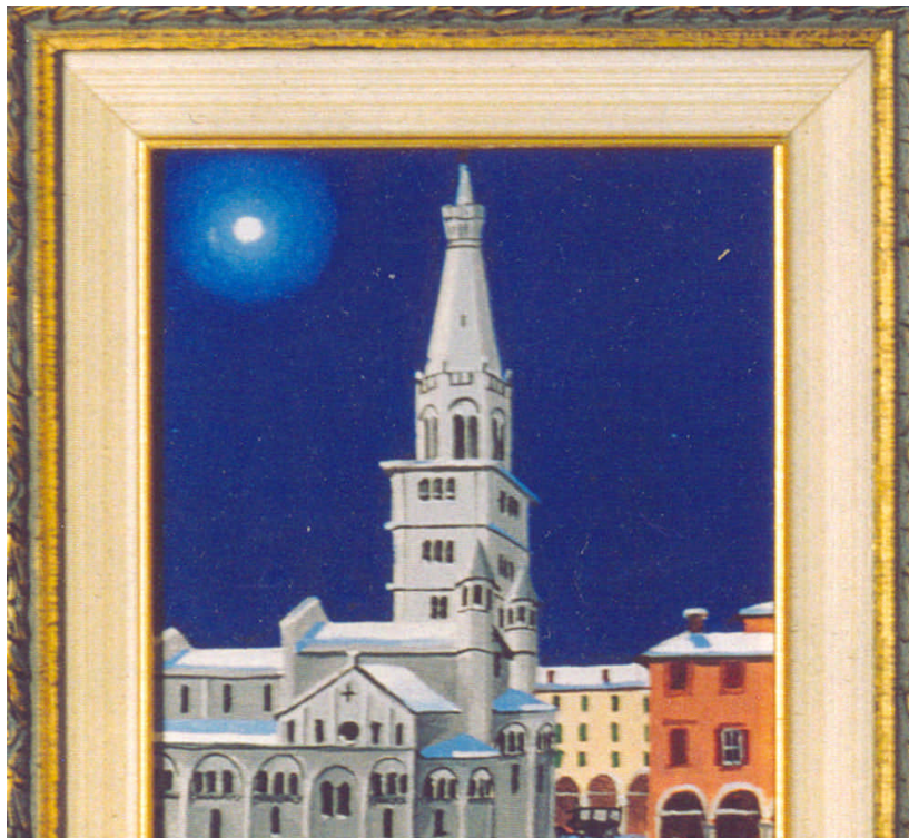
Nella foto: il quadro "Solstizio d'inverno in Piazza Grande a Modena" collezione di Marcello Ferrari