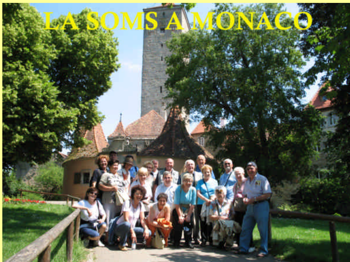
Foto di gruppo per i soci SOMS in gita a Monaco di Baviera a giugno