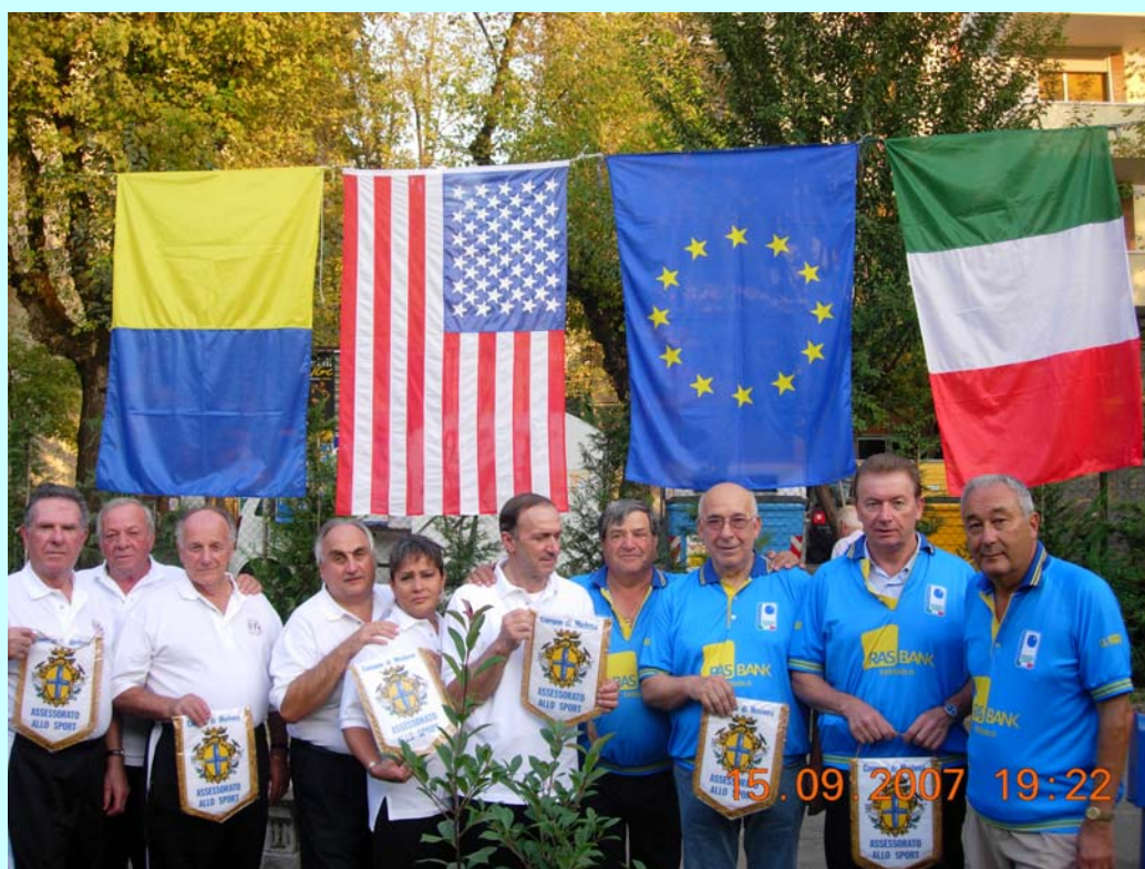
Nella foto: il gruppo dei giocatori ripreso sotto le bandiere