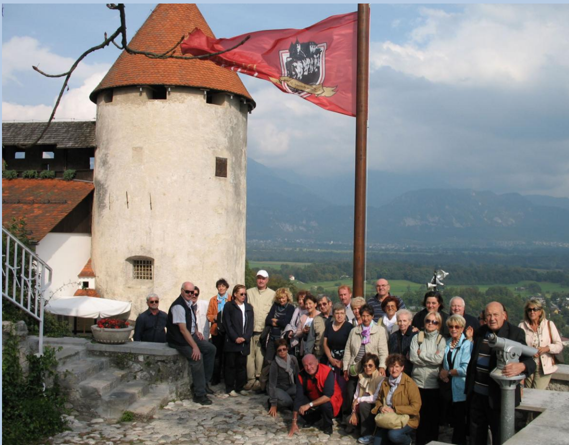
La SOMS in trasferta in Slovenia