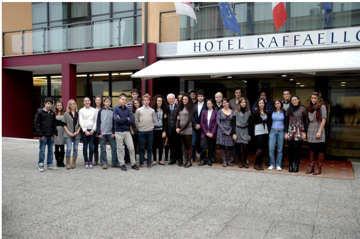
Il gruppo degli studenti premiati