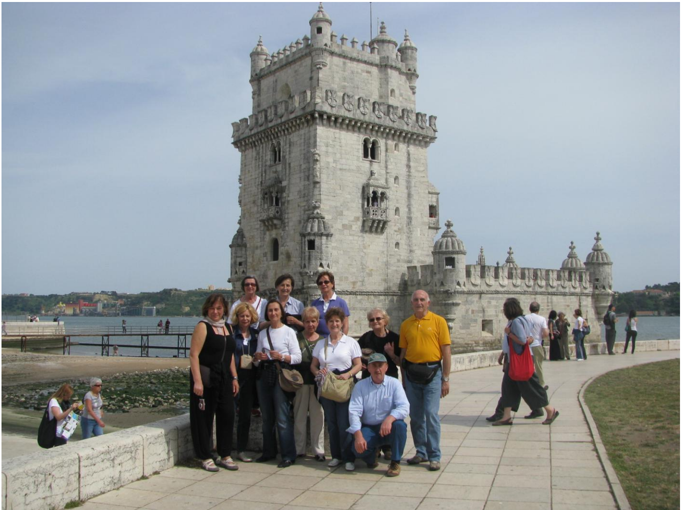
La SOMS in gita in Portogallo