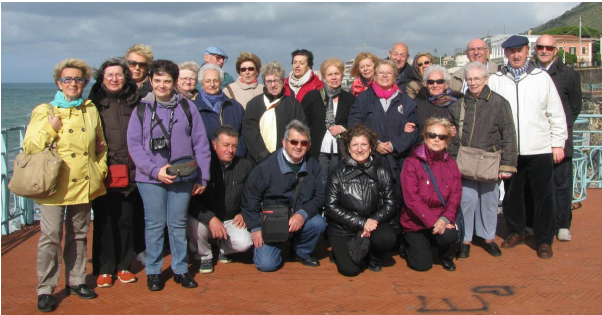
La SOMS in viaggio

Per finire non ci siamo fatti mancare una breve sosta a Lerici, che chiude il Golfo dei Poeti, per vederne il centro e il castello; da lì abbiamo iniziato il rientro a Modena.