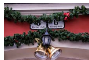
Decorazioni a Klagenfurt

giunto, sembrava di essere già alla vigilia della festa più importante dell'anno, luci e addobbi ovunque, uno spettacolo che solo i paesi di lingua tedesca riescono a rendere