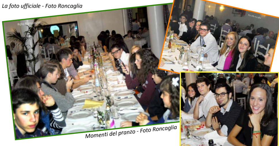
Momenti del pranzo