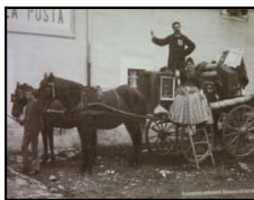
Un dentista "sui generis"

Abbiamo infatti avuto modo di vedere l'evoluzione del centro storico, in particolare di Piazza Grande, che in origine ospitava il mercato in seguito poi trasferitosi in Via Albinelli.