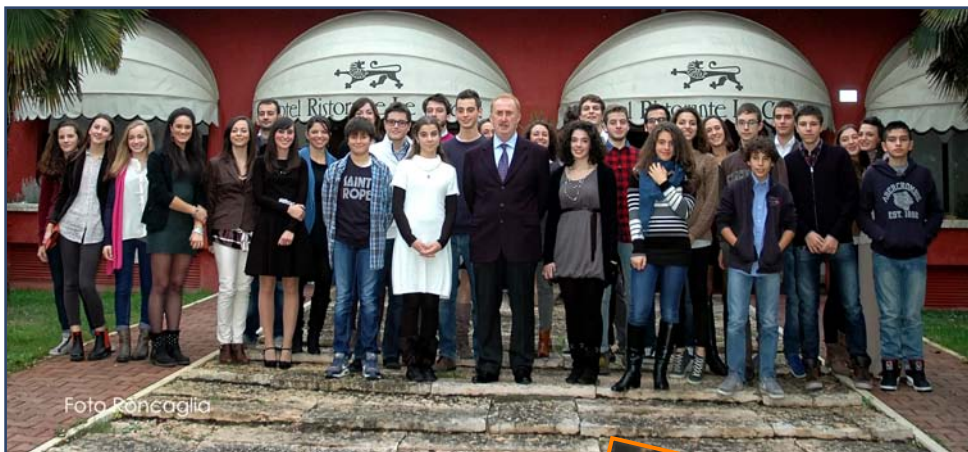
La foto ufficiale

I premi sono stati offerti da numerosi esercizi che hanno stipulato una convenzione con la S.O.M.S. Ringraziamo quindi: Banca Popolare dell'Emilia Romagna, Grandi Salumifici Italiani, Famiglia Prandini, Cantine Chiarli, Foto Roncaglia, Redipane Bakery Cafè, Nuovo autolavaggio, Costi calzature, Centro tessile arredo Modena, La bottega del fiore, Sanitaria Marco Cappelli SRL, Sanitaria Modenese SNC, Dimensioni Arredamento, Abbigliamento Barone Rosso, Parrucchieri Nilla & Fosco, Oltrestetica Modena, C'E' Bassetti Corso Canalchiaro 54/56, AB/Alberti & Bulgarelli, Libreria Nuova Tarantola, Orologeria oreficeria Righi Mario, L'officina verde del Cimone (erbolario) e Robintur MO.