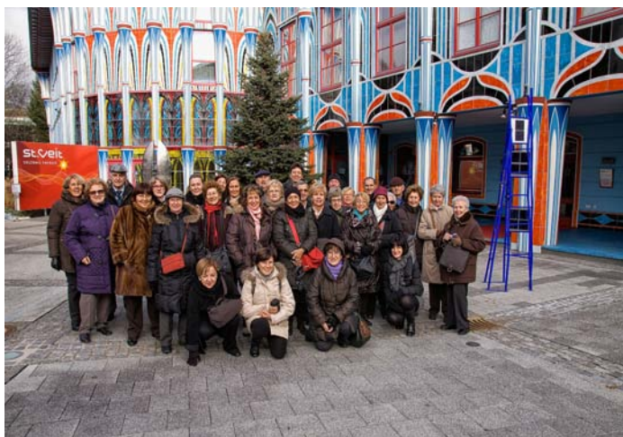
La comitiva della S.O.M.S. a Sankt Veit