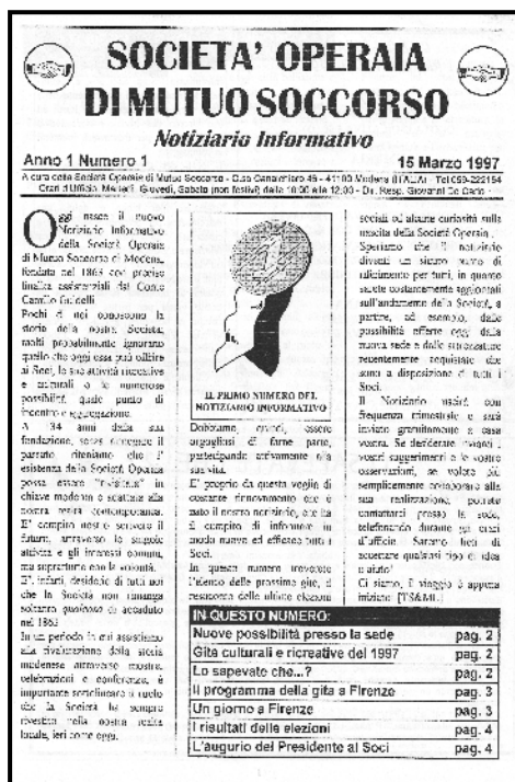
Il primo numero