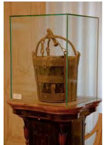
La secchia rapita

Dopo la battaglia di Zappolino del 1325, vinta dai modenesi che si impossessarono della famosa Secchia tuttora custodita nel palazzo comunale (quella nella Ghirlandina è una semplice copia), alcuni prigionieri reggiani, a loro onta, furono costretti a passare sotto le lance incrociate dei modenesi.