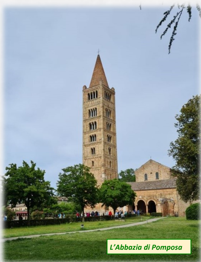
L'Abbazia di Pomposa

La giornata si è conclusa e siamo ripartiti in direzione Modena, passando da Bologna per accompagnare i nostri compagni di viaggio felsinei. La giornata ci ha permesso di visitare luoghi di grande interesse e di godere della piacevole compagnia dei partecipanti alla gita.... Arrivederci alla prossima Gita della SOMS.