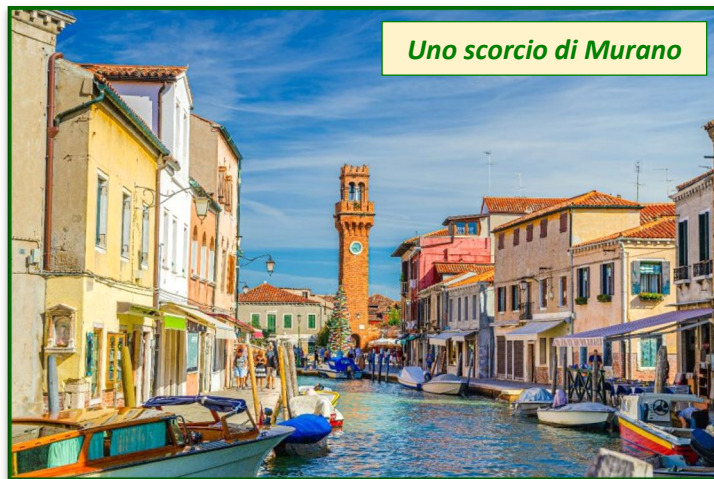
Uno scorcio di Murano

La quota non comprende: eventuali altri ingressi; mance ed extra di natura personale; tutto quanto non espressamente indicato nella voce la quota comprende.