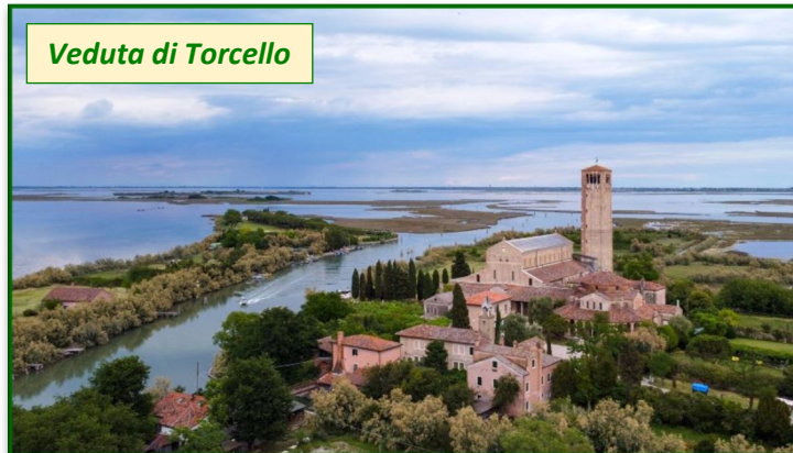
Veduta di Torcello

TORCELLO , una delle prime isole ad essere civilizzate, sito Unesco, ospita rarissimi edifici romanici con preziosi mosaici (S. Maria Assunta, S. Fosca). Visita con guida con ingresso alla Basilica S.Maria Assunta.